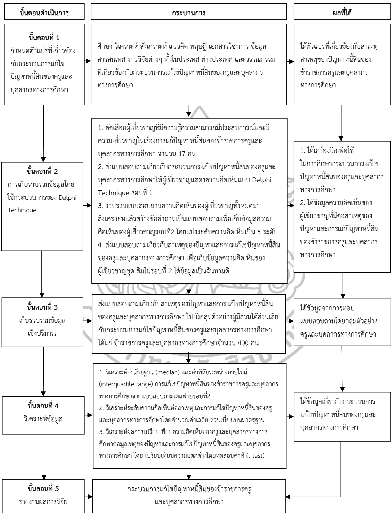
แผนภูมิที่ 5 ขั้นตอนการดำเนินการวิจัย