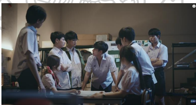
ภาพที่ 5 นักเรียนห้องกิฟต์ร่วมมือกันวางแผนเพื่อจัดขบวนการสอบวัดระดับ

ประการต่อมาคือ การร่วมมือกันของกลุ่มนักเรียนห้องกิฟต์ที่มีความสามารถแตกต่างกัน เพื่อเปลี่ยนแปลงระบบการศึกษาภายในโรงเรียน ดังภาพ