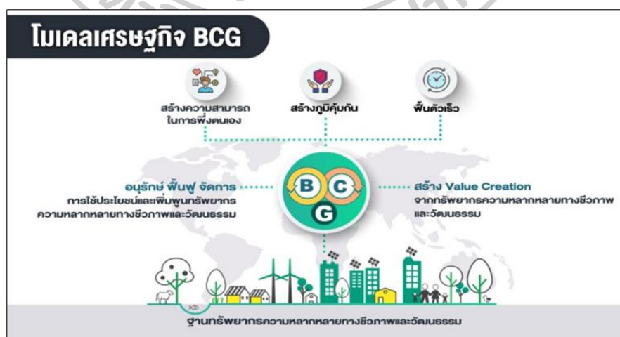
ภาพที่ 1 โมเดลเศรษฐกิจ Bio Circular Green

BCG Model คือ โมเดลเศรษฐกิจสู่การพัฒนาที่ยั่งยืน โดยนำวิทยาศาสตร์ เทคโนโลยี และนวัตกรรมไปยกระดับความสามารถในการแข่งขันอย่างยั่งยืนให้กับ 4 อุตสาหกรรมเป้าหมาย (S-curves) ได้แก่ อุตสาหกรรมเกษตรและอาหาร อุตสาหกรรมพลังงานและวัสดุ อุตสาหกรรมสุขภาพและการแพทย์ และอุตสาหกรรมการท่องเที่ยวและบริการ โดยวิทยาศาสตร์ เทคโนโลยีและนวัตกรรมจะเข้าไปช่วยเพิ่มประสิทธิภาพให้กับผู้ผลิตที่เป็นฐานการผลิตเดิม เช่น เกษตรกรและชุมชน ตลอดจนสนับสนุนให้เกิดผู้ประกอบการที่ผลิตสินค้าและบริการที่มีมูลค่าเพิ่มสูงหรือนวัตกรรม (ประชาคมวิจัยด้านเศรษฐกิจชีวภาพ เศรษฐกิจหมุนเวียนและเศรษฐกิจสีเขียว, 2561)